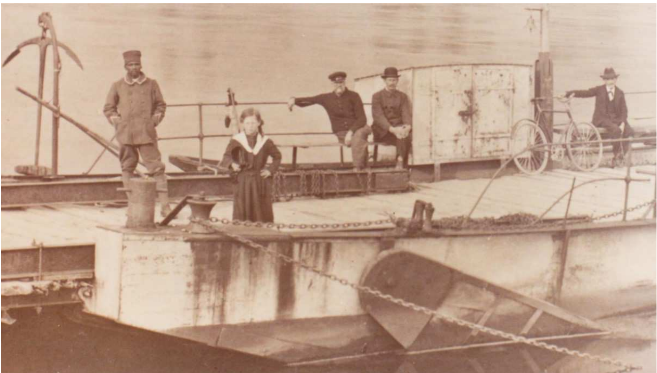
Abb. 6: Ein französischer Soldat des Kolonial-Infanterie-Regiments auf der Leimersheimer Fähre Anfang 1919.

Die Besetzungstruppen wurden sehr bald wieder aus dem Dorf abgezogen. Aber erst im Juni 1930 endete die Besetzung des linken Rheinufer durch Frankreich. 37