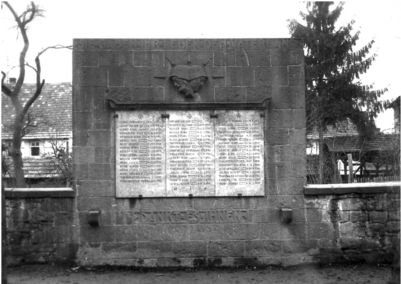
Abb. 7: Kriegerdenkmal in Leimersheim vom 11. September 1921.

„Sie gaben ihr Leben für das Vaterland – dankt es ihnen“ und die Namen von 53 gefallenen Soldaten standen auf dem Kriegerdenkmal, das in Leimersheim vor knapp einhundert Jahren vor dem Eingang der katholischen Kirche errichtet und am 11. September 1921 eingeweiht wurde. 38